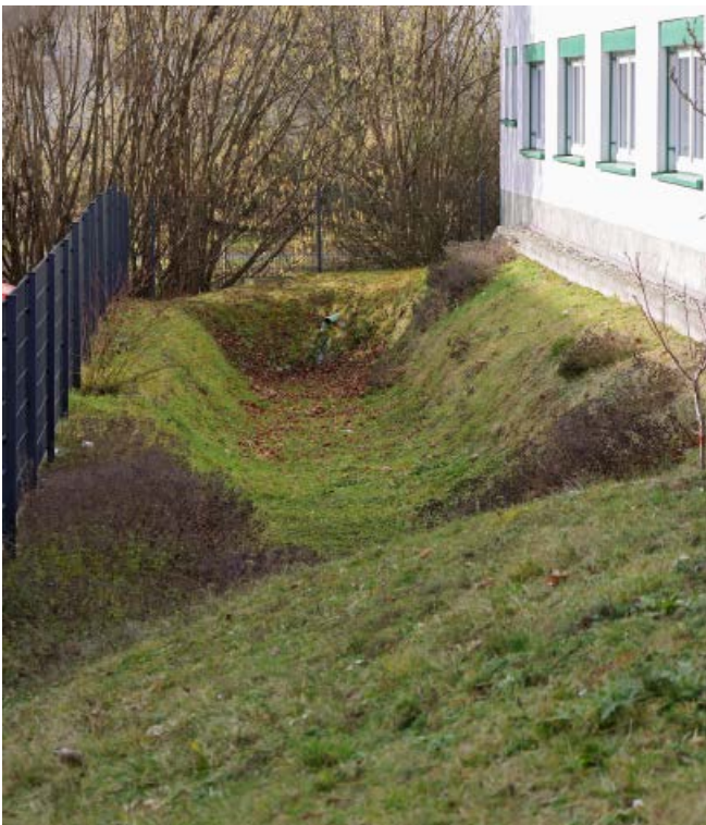
Abb. 9: Versickerungsmulde direkt an einem Gebäude

Weitere sinnvolle Maßnahmen sind natürlich die Entsiegelung und folglich die Versickerung des Regenwassers auf dem Grundstück durch Erhöhung des Anteils nichtversiegelter Flächen bzw. die Reduzierung der Abflüsse von Flächen mittels Rasengittersteinen, Fugenpflaster, wassergebundene Flächen oder auch Kiesbelag oder Schotterrasen (Abbildungen 5–7).