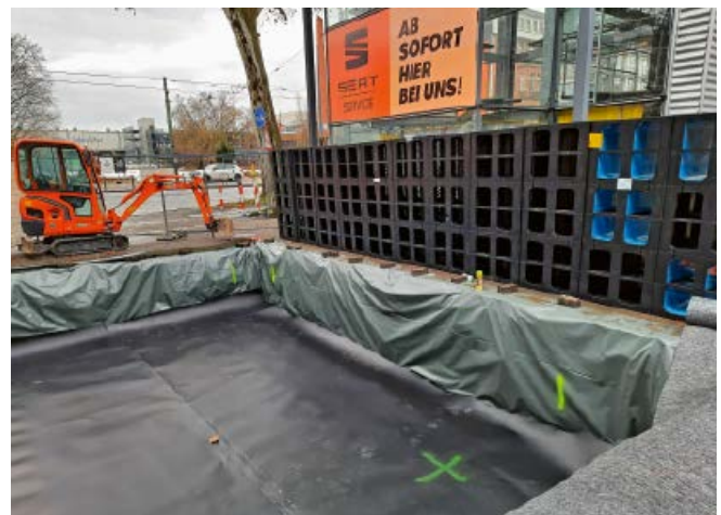
Abb. 14: Bau einer unterirdischen Versickerungsanlage

In Neubaugebieten soll durch öffentliche und private Maßnahmen erreicht werden, dass kein Regenwasser aus dem Gebiet abfließt. Die Forderung einer Regenwasserbewirtschaftung wird in Frankfurt für neue Baugebiete in den Bebauungsplänen festgeschrieben. Folglich ist sie, ebenso wie für Einzelbauvorhaben, ein zentrales Thema bei der Erteilung von Anschlussgenehmigungen. Die Herstellung und die Änderung der Grundstückentwässerungsanlagen bedürfen immer der Genehmigung durch die Stadt. Auch wenn sich die Einleitmenge ändert,