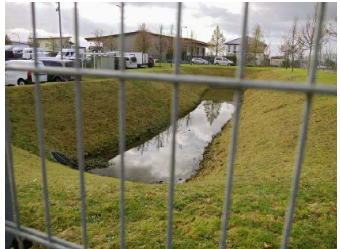
Abb. 8: Beispiel einer großen Versickerungsmulde

Auch oberirdische Versickerungsanlagen (Mulden) stellen eine geeignete Maßnahme zur Annäherung an den natürlichen Wasserkreislauf dar (Abbildungen 8–13). Auf Grundstücken können sie sehr unauffällig gestaltet werden und sind gut in die Gartengestaltung zu integrieren. Die erforderlichen Flächen sind weiterhin mit nur wenigen Einschränkungen gut nutzbar.