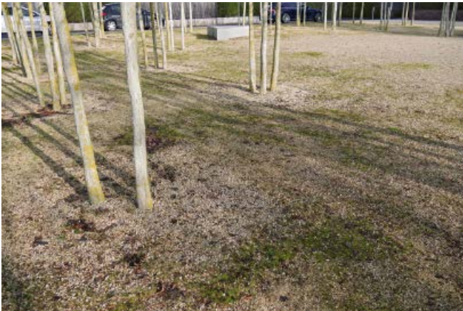
Abb. 7: Schotterrasen

wässerung Frankfurt am Main (SEF) Grundstückseigentümer*innen und Fachplaner*innen, wann immer möglich, Gründächer, die neben der Rückhaltung von Regenwasser mit einem Gewinn an Grünfläche verbunden sind und dank der Verdunstung des Wassers das städtische Klima positiv beeinflussen (Abbildung 4). Zumindest extensive Dachbegrünungen sollten in vielen Fällen möglich sein, sogar Hochhäuser können oftmals begrünt werden. Photovoltaikanlagen sind kein Ausschlusskriterium für ein Gründach, es kann sogar leitungssteigernd sein. Lediglich steil geneigte Dächer über 45° Dachneigung eignen sich nicht für die Begrünung.