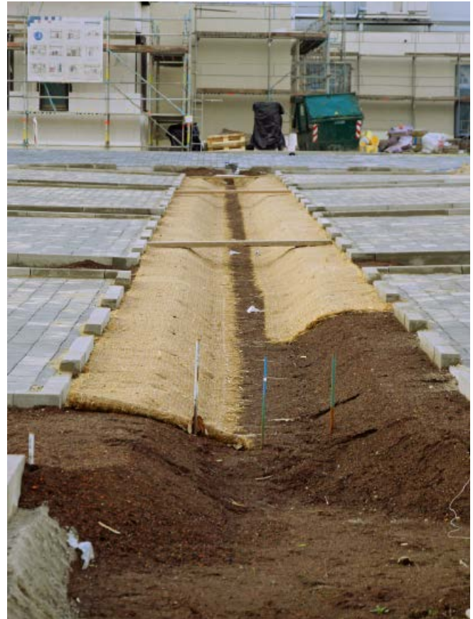
Abb. 12: Bau einer Versickerungsmulde auf einem Parkplatz