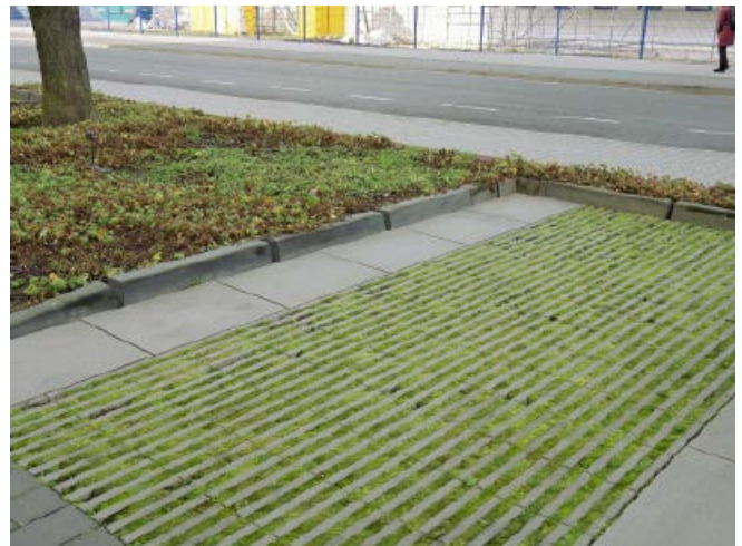
Abb. 6: Fugenpflaster

Um eine deutliche Verdunstung mit Abkühlungseffekt (Stichwort Verdunstungskühle) zu erzielen empfiehlt die Stadtent-