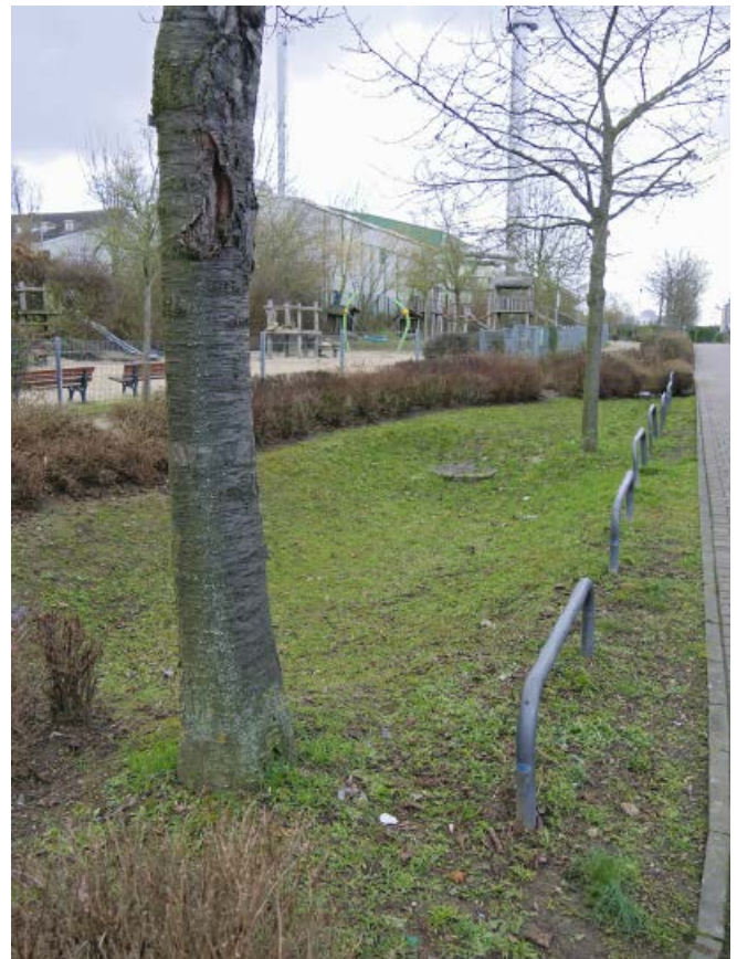
Abb. 16: Beispiel einer Versickerung im öffentlichen Raum