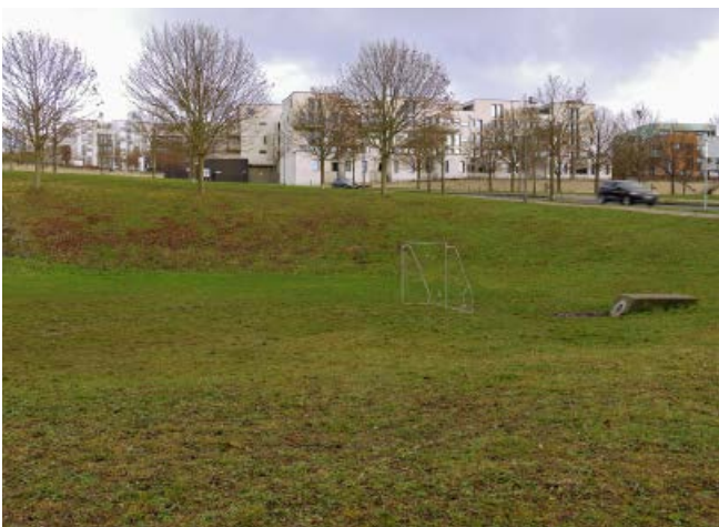
Abb. 13: Genutzte Versickerungsmulde

Unserer Erfahrung nach wird auf den Grundstücken in der Regel eine Kombination der genannten Methoden realisiert.