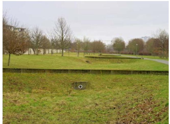
Abb. 2: Regenwasserrückhaltung in einem innerstädtischen Park

Die Prognose des Deutschen Wetterdienstes von 2011 zeigt, es wird in Zukunft mehr heiße Tage über 30 °C und Tropennächte mit mehr als 20 °C geben. Das bedeutet starken Hitzestress für die Bürger*innen Frankfurts sowie für Flora und Fauna. In der Folge sind vermehrte Rettungsdienstesätze und Krankenhauseinweisungen von Jung und Alt zu erwarten, möglicherweise auch mehr Hitzetote. Auch die Folgen für das Stadtgrün sind erheblich, so sind durch die warmen und trockenen Sommer 97 % der Bäume im Frankfurter Stadtgebiet