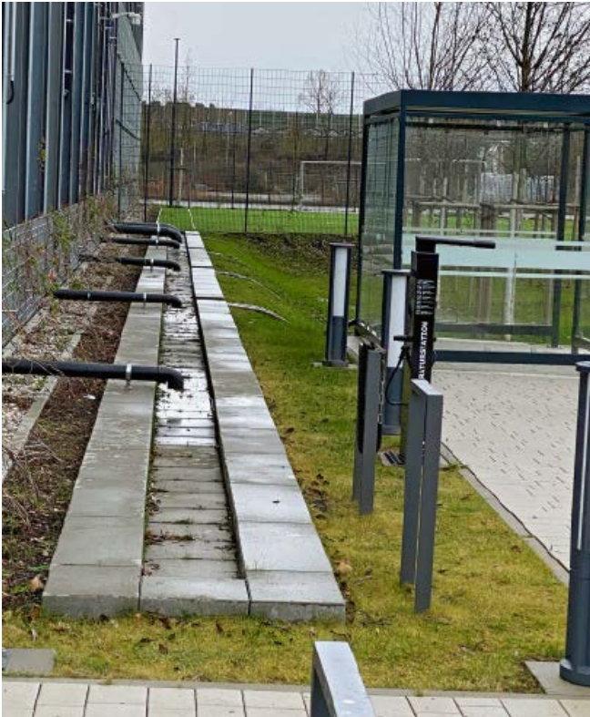
Abb. 11: Ableitung von der Dachfläche eines großen Gebäudes in eine Versickerungsmulde

Fällen aufwendiger und folglich kostenintensiver als oberflächlich angelegte Versickerungen (Abbildung 14).