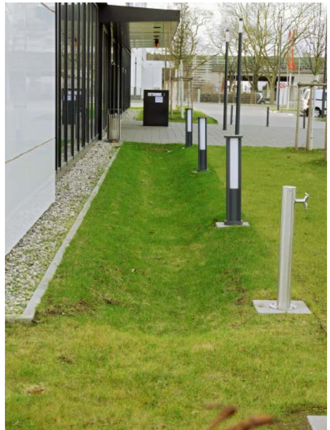
Abb. 10: Kleine Versickerungsmulde neben einem Eingang

Erst in zweiter Linie empfehlen wir unterirdische Versickerungsanlagen (Rigolen). Sie haben zwar keinen Abkühlungseffekt, tragen jedoch zur Anreicherung des Grundwassers bei. Außerdem ist die Herstellung von Rigolen in den meisten