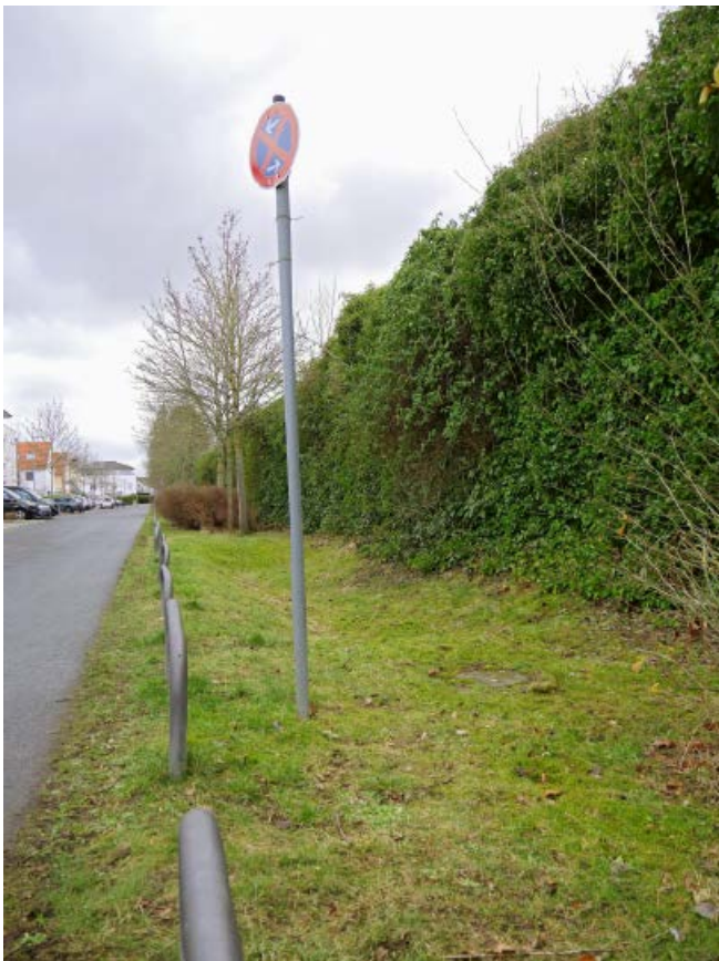
Abb. 15: Versickerungsmaßnahme entlang einer Straße

4.0-Technologieführer in der Wasserwirtschaft