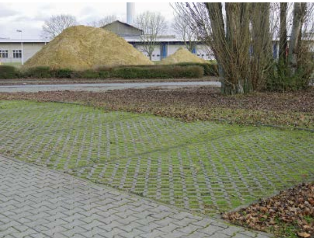
Abb. 5: Rasengittersteine

Beim natürlichen Wasserkreislauf verdunstet ein größerer Anteil des Regenwassers, und ein weiterer Anteil versickert. Es bleibt nur ein oberflächiger Ablauf, der in Frankfurt am Main mit etwa 10 \text{ l}/(\text{s} \cdot \text{ha}) beziffert wird. Dieser Zustand muss möglichst wiederhergestellt werden. Das Regenwasser soll dort, wo es auf die Oberfläche trifft, verbleiben, das heißt an der Oberfläche zurückgehalten, verdunstet, versickert oder genutzt werden (Stichwort Schwammstadt). Bei neu oder wieder zu bebauenden Arealen muss die Regenwasserbewirtschaftung von Anfang an städtebaulich mitgedacht werden (Abbildungen 2 und 3). Solche Maßnahmen sind Teil einer sogenannten blaugrünen Infrastruktur, die Starkregenvorsorge und städtisches Wassermanagement mit Grünelementen verbindet.