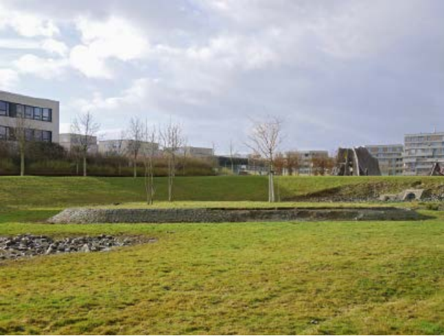
Abb. 3: Freifläche mit Regenwasserrückhaltung in einem Wohngebiet

Beim natürlichen Wasserkreislauf verdunstet ein größerer Anteil des Regenwassers, und ein weiterer Anteil versickert. Es bleibt nur ein oberflächiger Ablauf, der in Frankfurt am Main mit etwa 10 \text{ l}/(\text{s} \cdot \text{ha}) beziffert wird. Dieser Zustand muss möglichst wiederhergestellt werden. Das Regenwasser soll dort, wo es auf die Oberfläche trifft, verbleiben, das heißt an der Oberfläche zurückgehalten, verdunstet, versickert oder genutzt werden (Stichwort Schwammstadt). Bei neu oder wieder zu bebauenden Arealen muss die Regenwasserbewirtschaftung von Anfang an städtebaulich mitgedacht werden (Abbildungen 2 und 3). Solche Maßnahmen sind Teil einer sogenannten blaugrünen Infrastruktur, die Starkregenvorsorge und städtisches Wassermanagement mit Grünelementen verbindet.