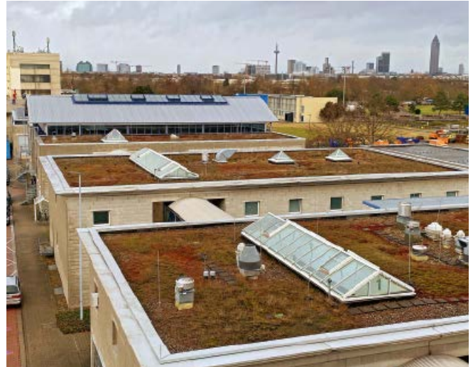
Abb. 4: Beispiel eines Gründachs

Regenwassermanagement ist sowohl auf öffentlichen Flächen als auch auf Privatgrundstücken zu planen. Eines geht nicht ohne das Andere. Auch bei der Planung auf den einzelnen Grundstücken besteht Handlungsbedarf. Die Stadt Frankfurt am Main fördert unter anderem Dachbegrünungen und Flächenentsiegelung mit dem Programm „Frankfurt frischt auf“ [4].